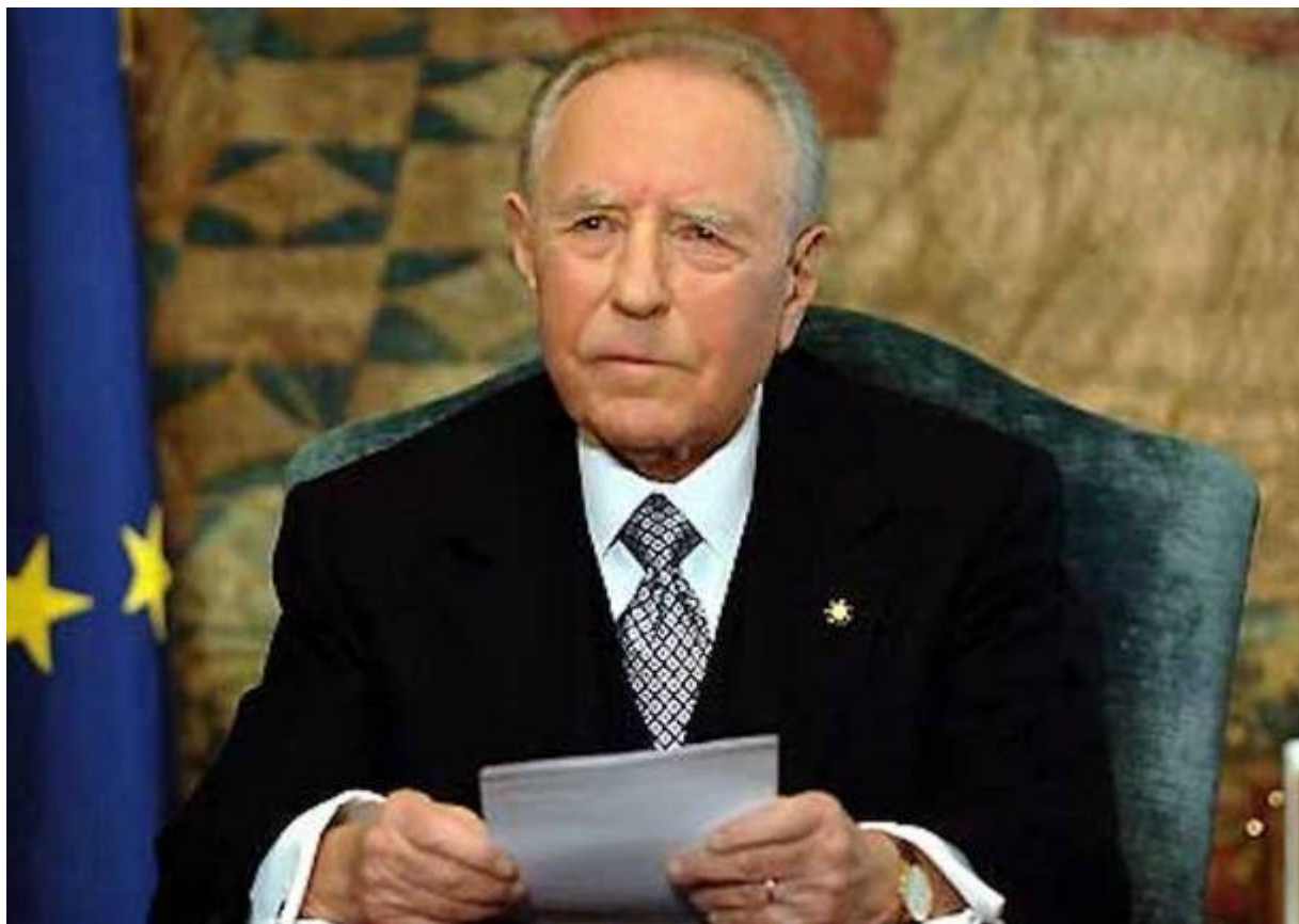
CARLO AZEGLIO CIAMPI 1999 – 2006

Ha rassegnato le dimissioni il 14 gennaio 2015. È divenuto Senatore di diritto e a vita quale Presidente Emerito della Repubblica.