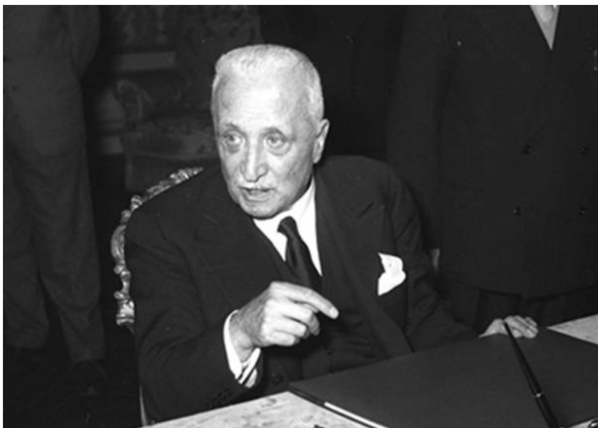
ENRICO DE NICOLA 1948

Enrico De Nicola è nato il 9 novembre 1877 a Napoli. Laureato in giurisprudenza, si è dedicato alla professione forense diventando nel corso degli anni uno dei maggiori avvocati penalisti italiani.