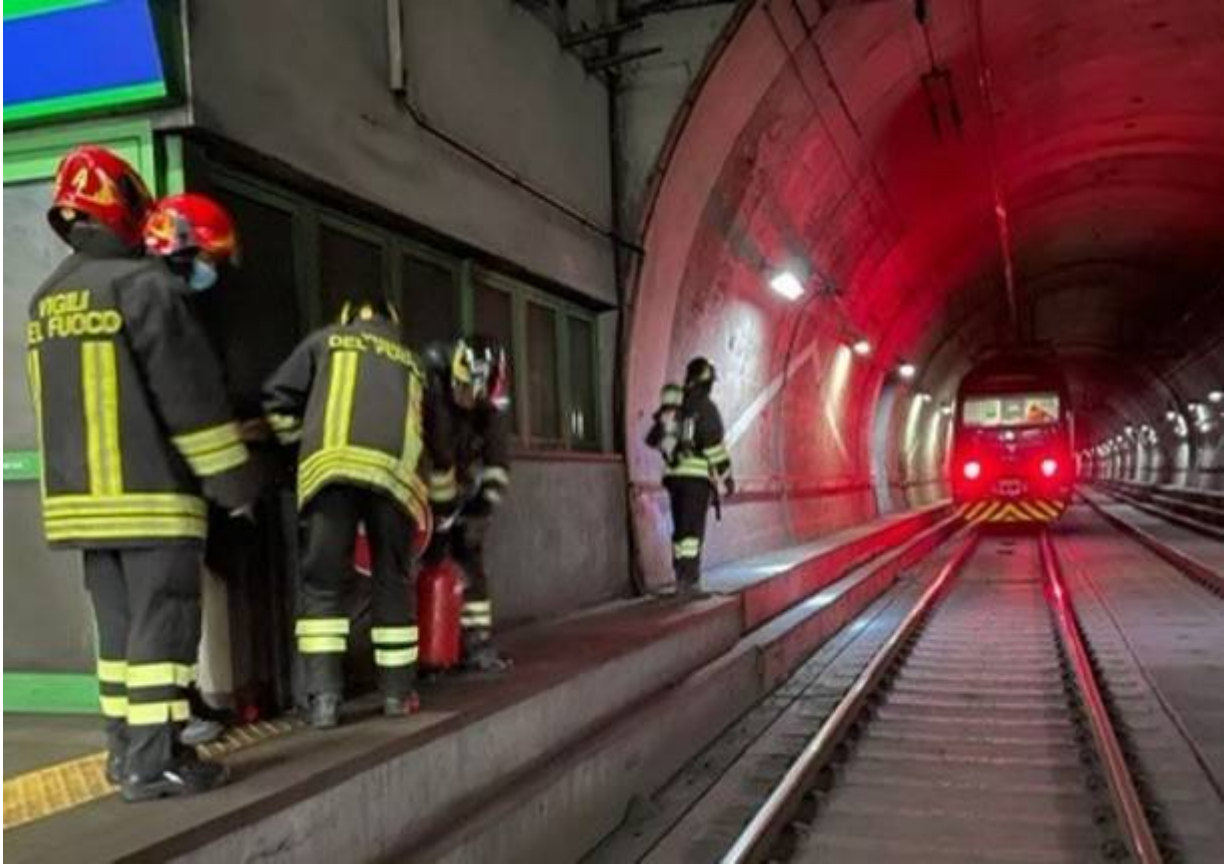
Incendio nel Passante