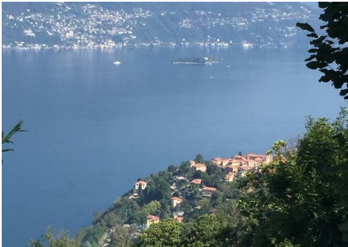
Tronzano Lago Maggiore