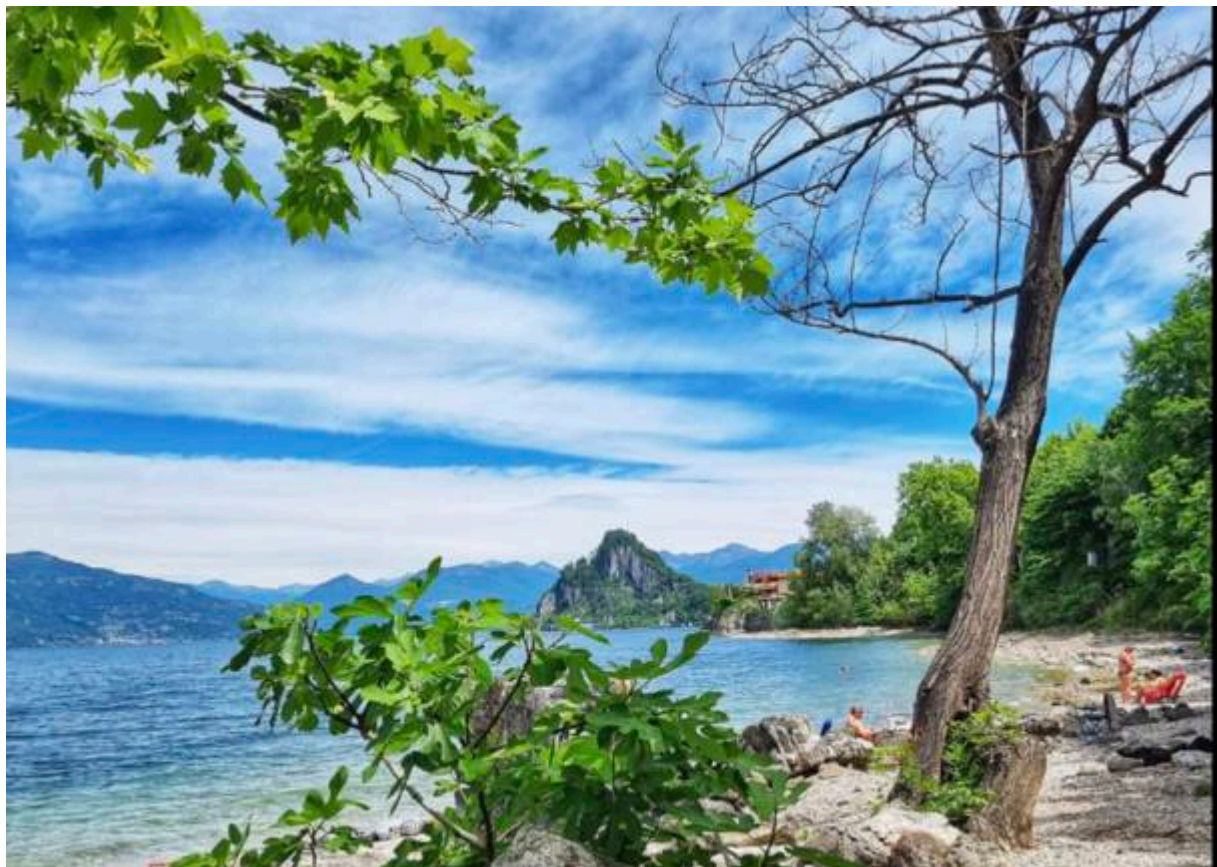
Spiaggia 5 Arcate