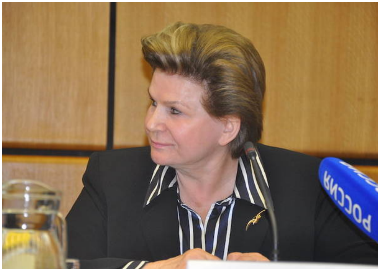
Valentina Tereskova nel 2013

L'attrice varesina ha lavorato negli ultimi anni anche all'interpretazione di un'altra figura femminile forte, quella di Florence Nightingale, prima infermiera in senso moderno, fiduciosa nella scienza, profemminista. «Dal 2017 la interpreto per l'Università Insubria di Varese, il 12 maggio 2020 dovevamo rappresentarlo per i 200 anni della nascita, ma purtroppo è saltata». ?Destino comune a tante produzioni fermate nell'arco di un anno , compreso proprio lo spettacolo "La donna delle stelle" dedicato a Valentin Tereskova: «Dovevamo rappresentarlo per la prima volta al teatro di Bisuschio, a ottobre» racconta ancora l'autore Fabio Borghetti «C'era già locandina pronta, ma poi c'è stato un altro stop alle rappresentazioni teatrali» .