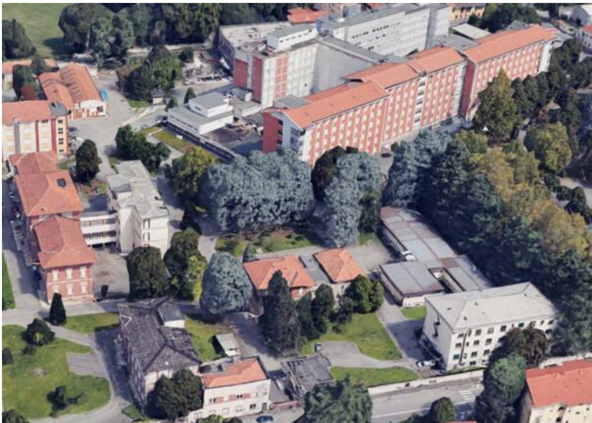
L'ospedale vecchio di Legnano visto da Google Earth

Il primo padiglione dell'Ospedale di Legnano fu inaugurato il 18 ottobre 1903 e contava 40 posti letto: negli anni '70 il nosocomio, che alla chiusura aveva 750 posti, arriverà a contarne un migliaio. Il progetto di massima per la struttura prevedeva la realizzazione di cinque padiglioni e di una palazzina per la direzione . Da lì, in oltre un secolo di storia ( raccontato da Giorgio D'Ilario nel volume "1903 – 2003. Ospedale di Legnano, un secolo di storia" ) l'ospedale è gradualmente cresciuto, di padiglione in padiglione e di reparto in reparto : tra gli ultimi, a cavallo del nuovo millennio, figurano la cardiocirurgia e i padiglioni destinati alle malattie infettive e al reparto maternità.