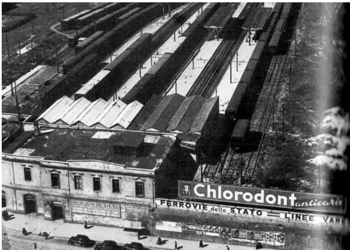
La stazione di Milano Porta Nuova negli anni Cinquanta. A fianco della pubblicità del dentifricio Chlorodont si vede l'indicazione a caratteri cubitali "Linee Varesine"