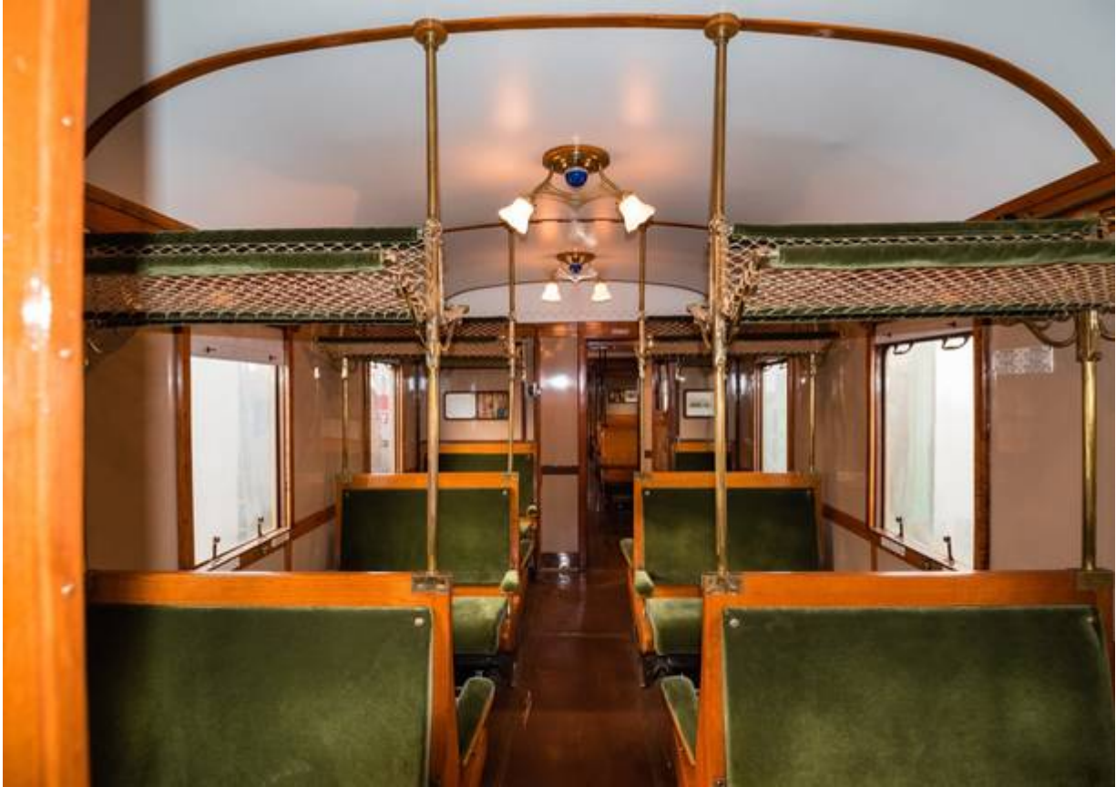
L'interno della motrice E623 restaurata

C'è però un altro uso del nome che ci porta fino ai giorni nostri : è quello della “stazione delle varesine” a Milano, sopravvissuta per trent'anni, dal 1931 al 1961, quando i binari furono accorciati alla zona Porta Garibaldi, con l'apertura della stazione che frequentano migliaia di pendolari milanesi di oggi. Lo spazio occupato dalla vecchia stazione rimase incolto e per decenni ospitò un luna park che tutti conoscevano, appunto, come “le varesine” .