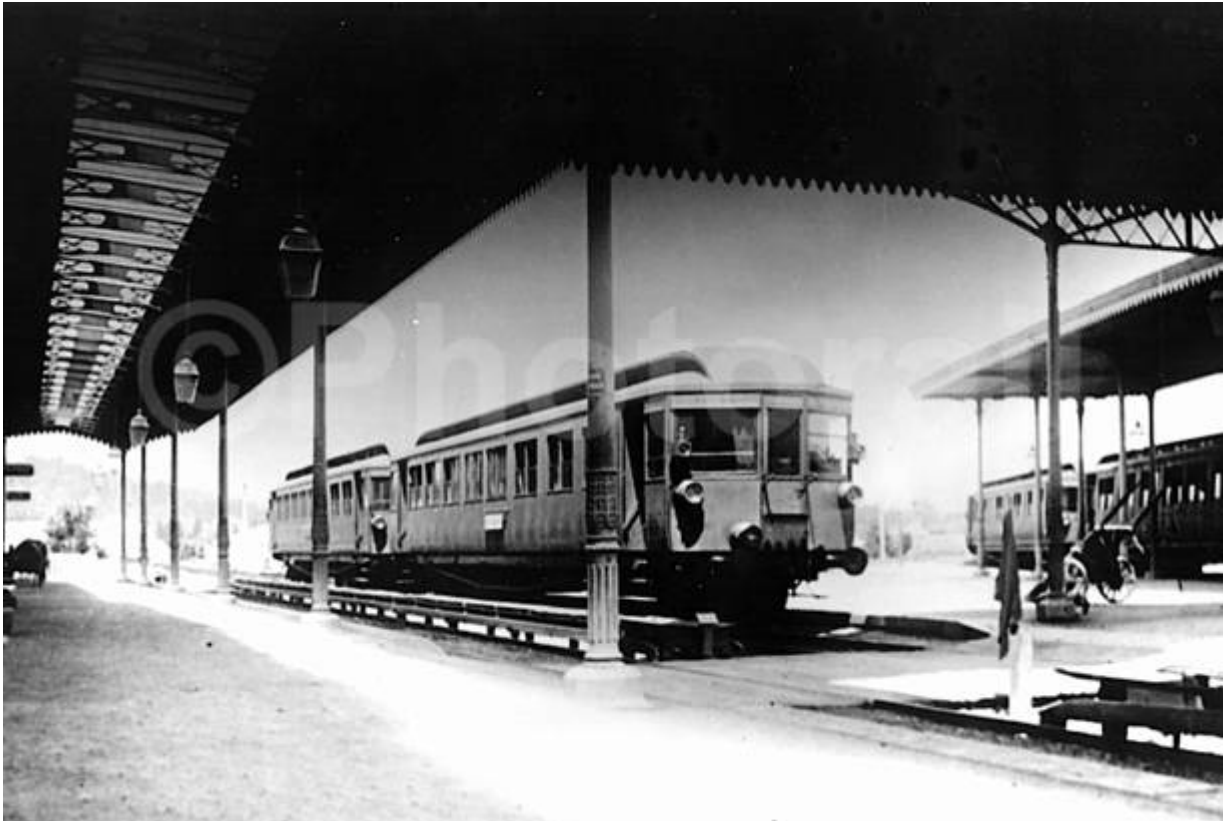
a Varese, 1905 - Bruno Bonazzelli Coll. Claudio Pedrazzini

La stazione di Varese nel 1905, con i nuovissimi treni elettrici "a terza rotaia". Foto dal sito photorail.it