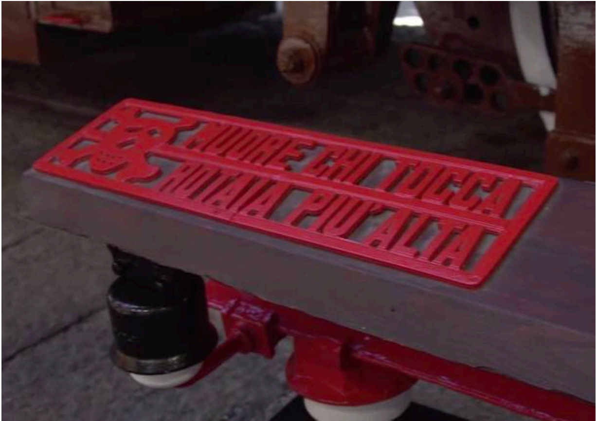
La terza rotaia ricostruita al Museo Nazionale delle Ferrovie a Pietrarsa , nei dintorni di Napoli

Dopo la Seconda Guerra Mondiale si decise di elettrificare anche la linea Milano-Domodossola (1947), ma questa volta con il più moderno sistema a 3000 Volt, quello in uso ancora oggi.